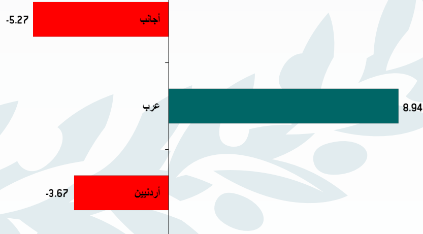
مليون دينار - صافي الاستثمار فئات المستثمرين الرئيسية