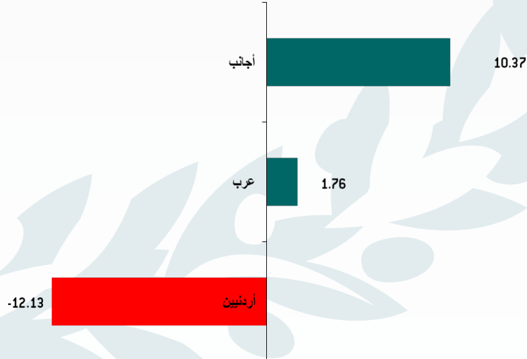
مليون دينار - صافي الاستثمار فئات المستثمرين الرئيسية